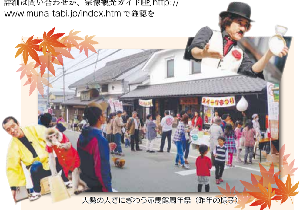
大勢の人でにぎわう赤馬館周年祭(昨年の様子)

※正助ふるさと村へは20~30分間隔で運行。 詳細は問い合わせか、宗像観光ガイドHP http://www.muna-tabi.jp/index.html で確認を