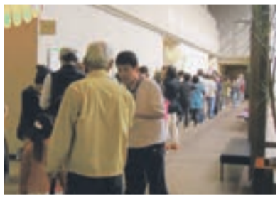
ブックリサイクル整理券配布