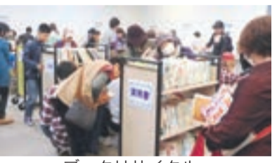
ブックリサイクル