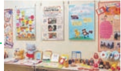
ボランティアの部屋