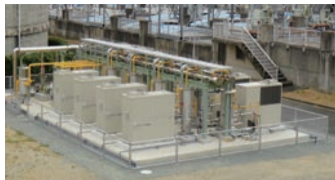
完成した発電設備

下水道の持つエネルギーが電気に生まれ変わります！ 宗像終末処理場では、下水を処理する過程で発生する消化ガスと呼ばれるメタンガスを燃料とした発電設備が完成。9月15日から発電を開始しました。消化ガスは地球環境にやさしい再生可能エネルギー(バイオガス)です。発電した電気は、終末処理場を動かすための電気の一部として使用することで、電気代の削減を図ります。併せて温室効果ガスである二酸化炭素を削減し、地球温暖化防止に努めます。 今後、下水道の持つエネルギーを有効に活用し、下水道経営の効率化を進めていきます。見学希望は、問い合わせを。