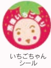
いちごちゃんシール