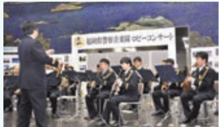
福岡県警察音楽隊

交通事故のない「安全・安心なまち宗像・福津」を目指し、宗像市、福津市、宗像交通安全協会、宗像警察署が合同で開催します。