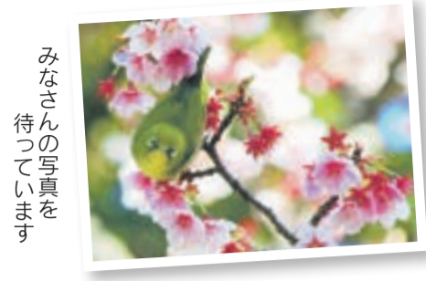
みなさんの写真を待っています