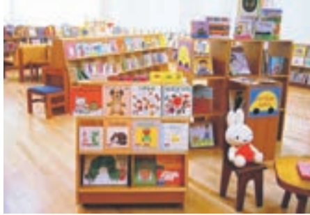
えほんのへやに遊びに来てください