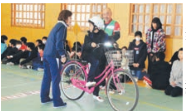
左右をしっかり確認

自転車通学をする生徒が多い中央中学校。今春、同中に入学予定の東郷・南郷小6年の児童たちへ、入学に向けて自転車の交通ルールを学んでもらおうと、東郷と南郷の両地区コミュニティ運営協議会が自転車交通安全教室を実施しました。