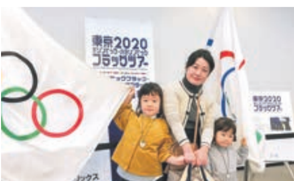
フラッグを持って記念撮影

宗像ユリックスで、オリンピック・パラリンピックのマークが入ったツアーフラッグの展示を実施。会場には多くの人が訪れ、フラッグに見入ったり、記念撮影をしたりしていました。中には「1964年大会のときは聖火リレーを見に行った」など、前回の東京大会の思い出を語る人もいました。2年後に迫る東京2020大会をより身近に感じる機会になったようです。