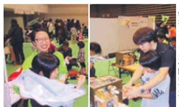
学生スタッフが体験に協力

大学の力をまちづくりに生かすため活動する同協議会は、本年度も学生スタッフと共に市子どもまつりに参加しました。同まつりの体験ブースでは、福岡教育大学の木工こまづくり体験、日本赤十字九州国際看護大学のナース・救護服試着体験とAED講習を実施し、200組以上の子どもたちが体験に参加しました。