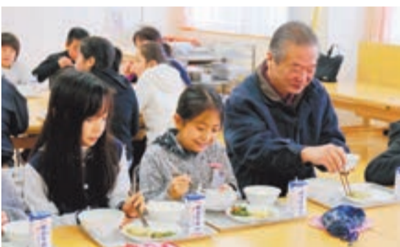
給食を通して会話も弾みます

全国学校給食週間（1月24日～同30日）にあわせて、市内小中学校ではさまざまな取り組みが行われました。玄海小学校では、給食委員会の児童たちが、調理員や給食納入業者のみなさんへ感謝の気持ちを