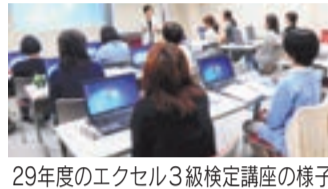
29年度のエクセル3級検定講座の様子

3つの資格取得講座（調剤薬局事務、エクセル3級検定、ファイナンシャルプランニング技能検定）を実施。子育て世代や定年後のスキルアップを目指す人など、幅広い世代の人が資格取得に挑戦しました。