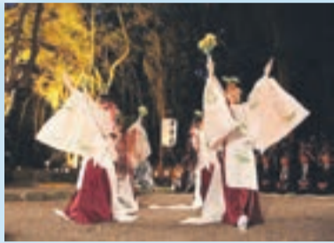
高宮神奈備祭「悠久舞」奉納