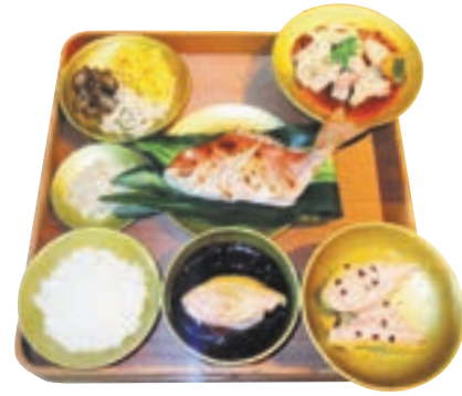
山と海の多くの珍味が提供された朝鮮通信使の相島での本膳レプリカ

江戸時代の享保4(1719)年8月10日、風波を避けて地島に寄港した第9次朝鮮通信使は、同月18日早朝、地島を出港しました。