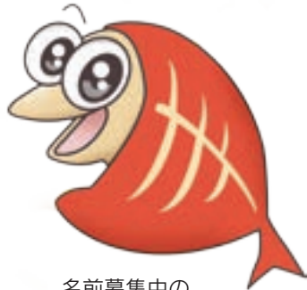
名前募集中の干物キャラクター