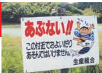
このような看板がある所は危険です 気を付けましょう

農作業が盛んとなる梅雨期から台風期にかけて、ため池や水路での水難事故が発生しています。特に近年は、局地的に起こる集中豪雨で、ため池や水路の水位が急に上がり、水の流れも速くなるので、とても危険な場所になります。