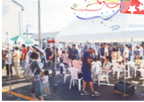
たくさんの方でにぎわいます