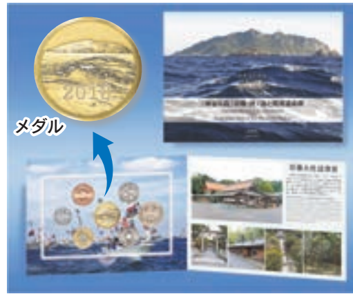
写真も美しい貨幣セット

④ 造幣局 * 詳細は HP https://www3.mint.go.jp/ で確認を ④ 造幣局ハローダイヤル ☎050(5548)8686 (受付は 8:00 ~ 21:00)