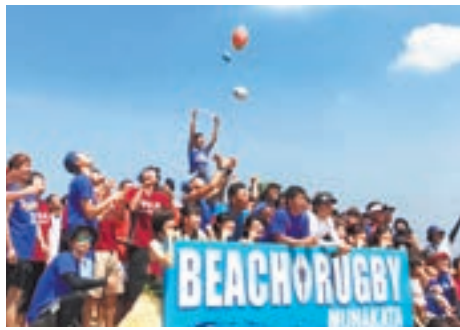
今年もビーチで盛り上がりましょう!