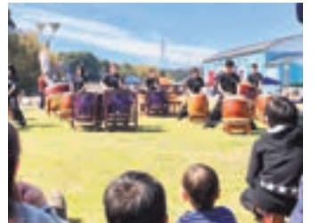
楽しいイベント盛りだくさん

期 6月3日(日)10:00～14:00 所 くらじの郷(鞍手町) 田▶イベントについて=くらてのまるしえ実行委員会(鞍手町役場内) ☎0949(42)2111▶記事について=市経営企画課 ☎(36)1192