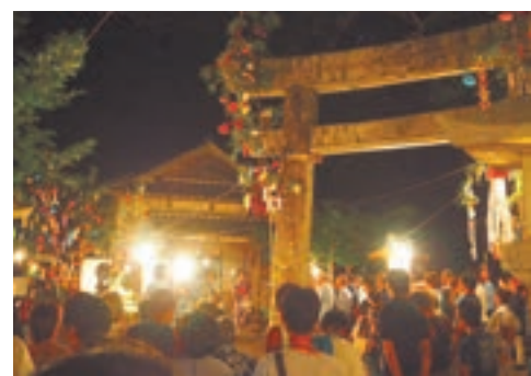
七夕飾りが幻想的な宗像大社中津宮

〇元気な島づくり事業推進協議会事務局 (大島行政センター内) ☎(72)2211