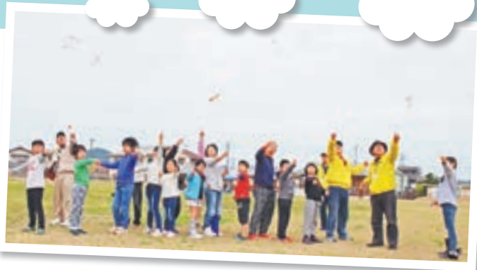
大空高く飛ばそう!