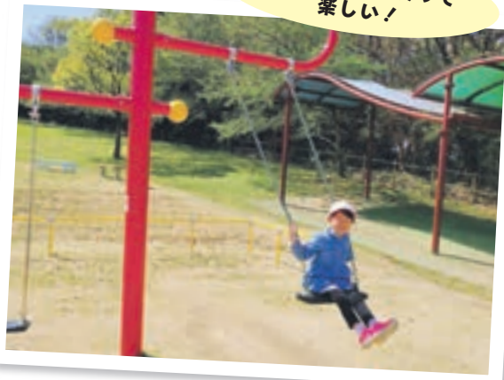
新しい遊具もあって楽しい!

●ふれあいの森総合公園 (山田 1619-8) * 同公園管理事務所 ☎(35) 6548 〇秘書政策課広報報道担当 ☎(36) 1055