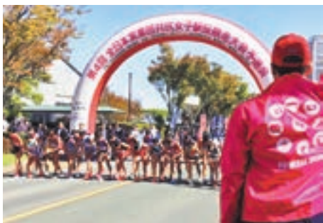
秋空の下、スタートしました

第4回プリンセス駅伝 in 宗像・福津全日本実業団対抗女子駅伝競走大会予選会が10月21日、多くのボランティアのみなさんのおかげで無事終了しました。両市あわせて1,000人を超えるみなさんがピンクのジャンパーに身を包み、交通規制、給水所、振る舞いの運営などに協力してくれました。