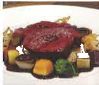
●● ビストロ アン・ココット 福岡市博多区

福岡の名店で腕をふるう料理人たちが宗像を訪れ、畑や牧場、漁港を見学。 生育環境に触れ、生産者と語り、 厳選した食材を使ってオリジナルメニューを作っていました。 宗像の“おいしい！”を満喫できるフェア。 話題のあのお店で、ぜひご体験ください。