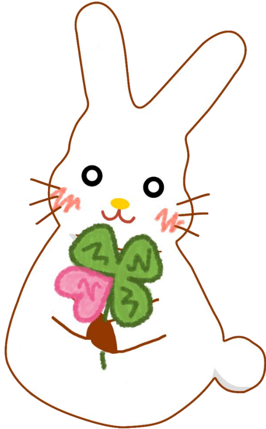
イメージキャラクター 「ふくちゃん」