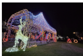
昨年のグローバルアリーナイルミネーション

赤馬あびす座は須賀神社。北斗の水くみイルミネーションは熊越池公園、グローバルアリーナでは12月1日よりミニイルミネーションが開催されます。これを機会に各所にも訪れてみてください。