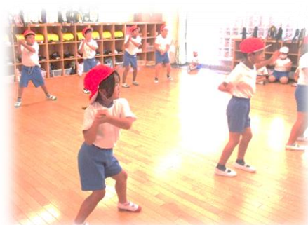
表現運動の練習に励む1・2年生