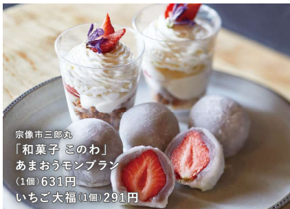
宗像市三郎丸 「和菓子 このわ」 あまおうモンブラン (1個) 631円 いちご大福 (1個) 291円