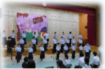
7年生合唱「マイパレード」