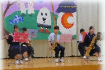
吹奏楽部による演奏「The fox」他