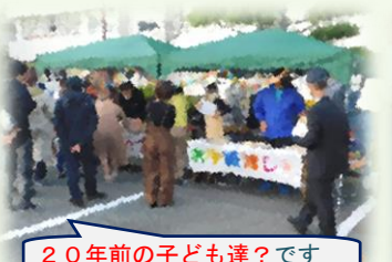
20年前の子ども達？です