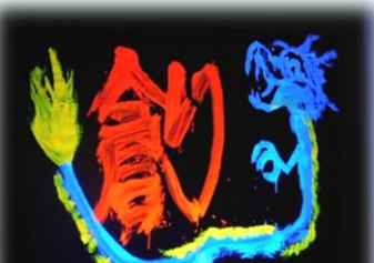
美術部による見事なパフォーマンス