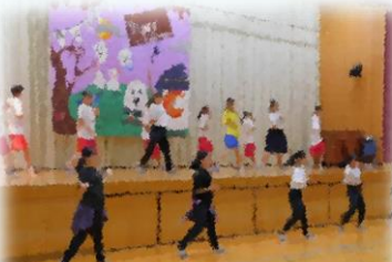
「夢プロジェクト」城東高校ダンス部による演技