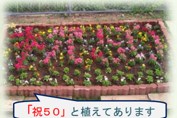
「祝50」と植えてあります