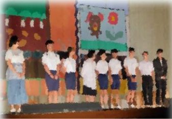
9年生劇「開拓村のかあさんへ」

10月15日（土）、玄海中学校で文化祭が開催されました。今年のスローガンは《Story～ここでしか作れない物語を～》とし、午前中は9年生の劇やステージ発表、各学年の合唱等が行われ、午後からは「夢プロジェクト」城東高校ダンス部によるすばらしい演技が披露されるなど、生徒達にとって、とても有意義な1日となりました。