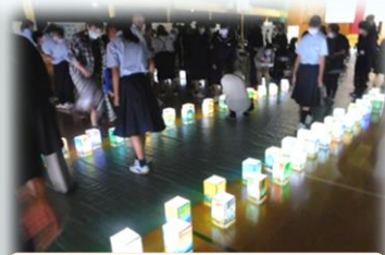
「みあれ祭」用に制作した灯籠