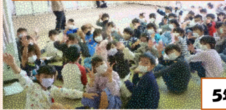
5年生 考えよう！としをとるって