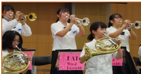
吹奏楽部による演奏