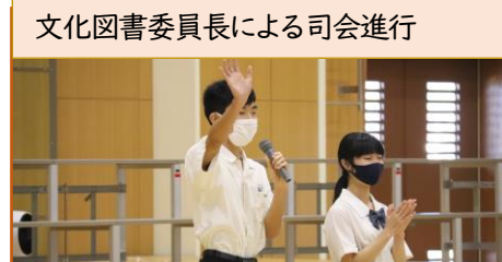
文化図書委員長による司会進行