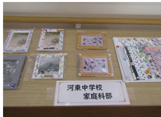
【河東中家庭科部の作品】