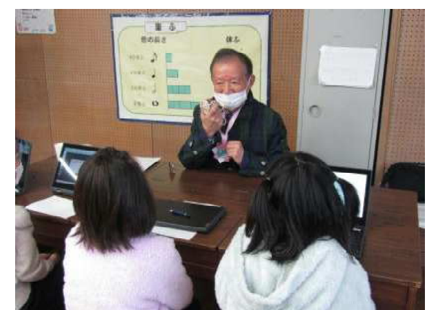
【河東西小での授業の様子】