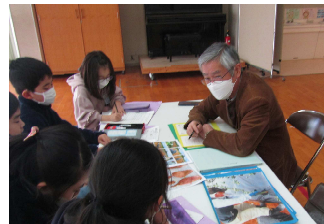
【河東小での授業の様子】