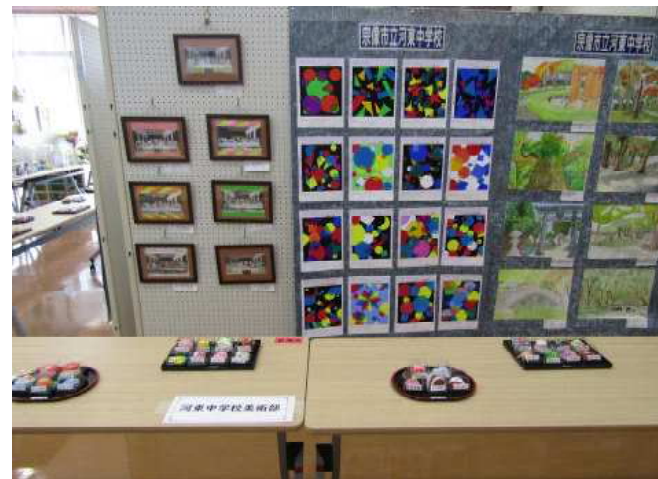
【河東中美術部の作品】