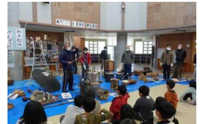
【河東歴史研究会による授業の様子】

1月30日(月)に河東小で、31日(火)に河東西小で、3年社会科「かわる道具とくらし」の授業がありました。この授業には、ゲストティーチャーとして、河東歴史研究会の方々に参加していただきました。最初に、歴史研究会の方々から古道具の説明をしていただき、その後、子どもたちは石臼、唐箕など実際に体験させていただきました。時間が足りないくらい子どもたちは大変喜んで、古道具の体験をすることができました。