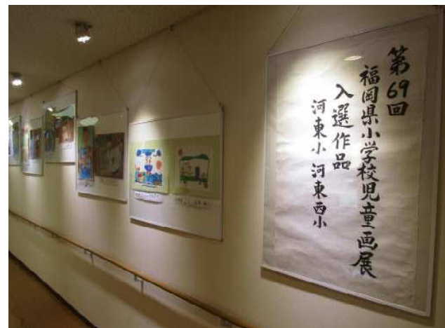
【河東小・河東西小県児童画展入選作品】

2月4日(土)、5日(日)に河東コミセンで、地域住民の芸術・文化・芸能への関心を高めることを目的とした第9回かとコミ文化祭が開催されました。今回は、河東中美術部の砂絵作品、粘土作品、水彩画、ポスターや家庭科部の手芸小物、マグネット、かみかざり、デコレーションBOXや河東小・河東西小の県児童画展入選作品を展示してもらいました。また、宗像市民図書館より、かとう学園の児童・生徒の図書に関する作品を展示してもらいました。展示作品を通して、かとう学園と地域住民相互のふれあい、親睦を深める場になりました。