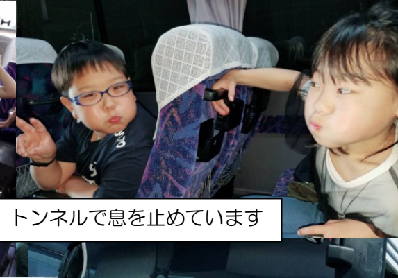
トンネルで息を止めています