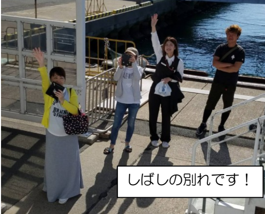
しばしの別れです！