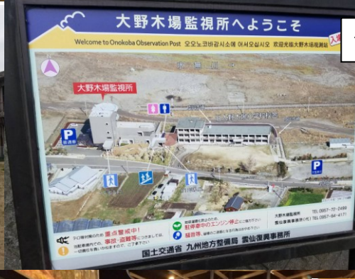
一応お勉強もしています