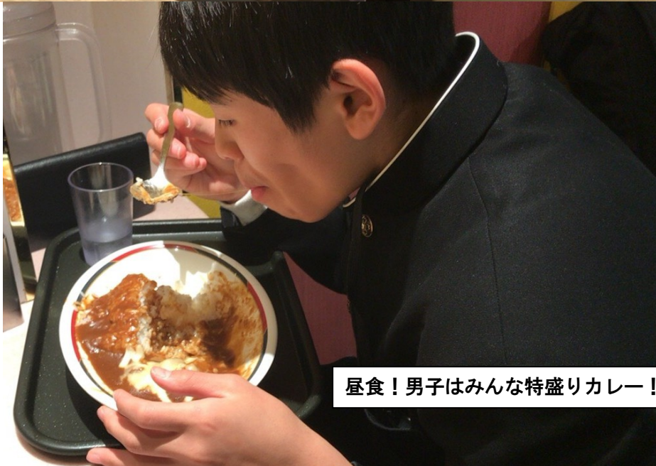
昼食！男子はみんな特盛りカレー！