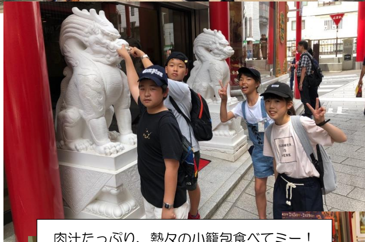
肉汁たっぷり、熱々の小籠包食べてミー！