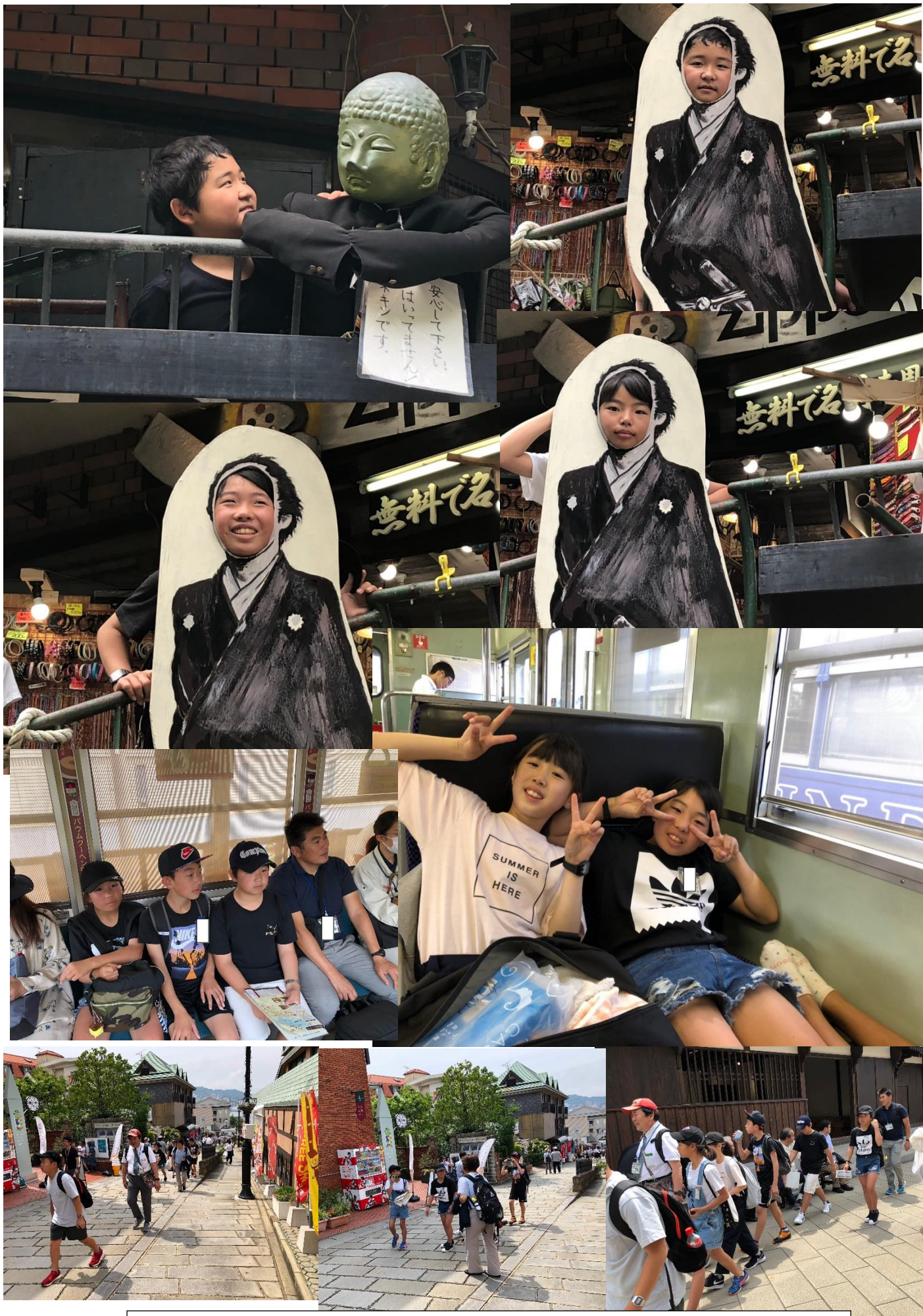
暑くて、長崎は坂道だらげやん、きつー！今日はみんなぐっすりやね！