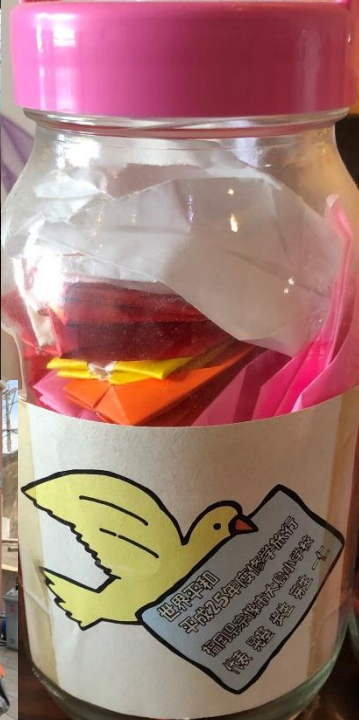
先輩たちの千羽鶴 です！