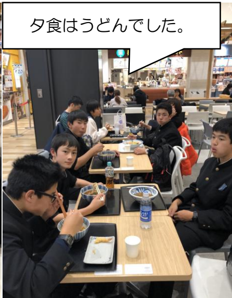
夕食はうどんでした。