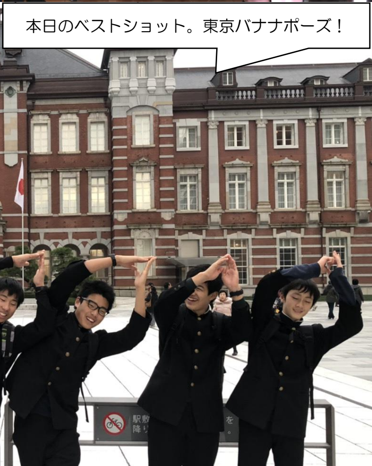
本日のベストショット。東京バナナポーズ！