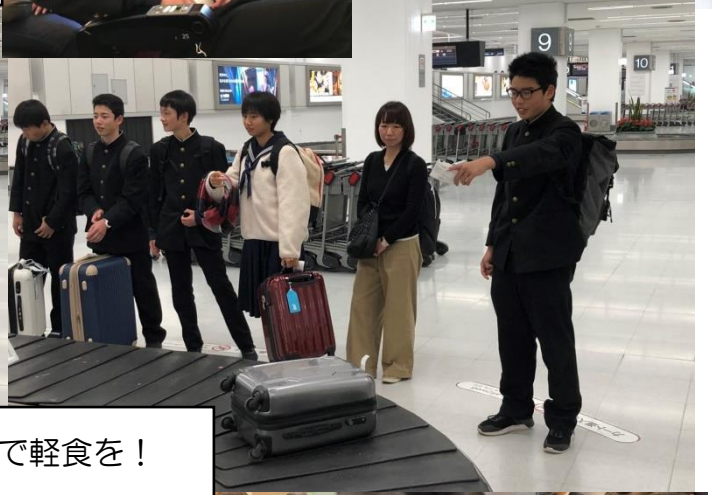
昼食は羽田で軽食を！