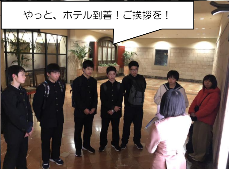
やっと、ホテル到着！ご挨拶を！