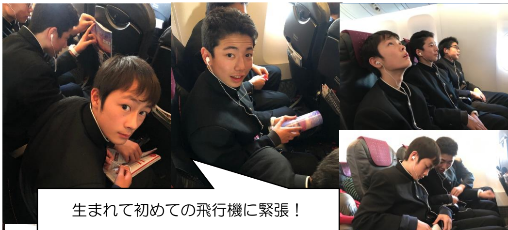
生まれて初めての飛行機に緊張！