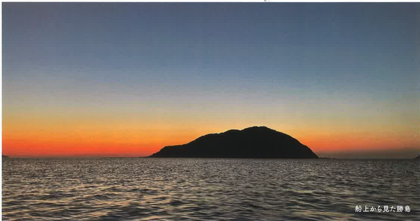
船上から見た勝島