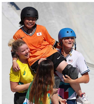
↑岡本選手とその仲間達