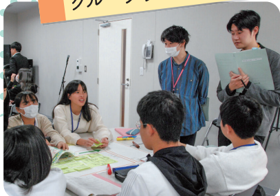
グループワークの様子※