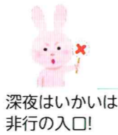
深夜はいかいは非行の入口!