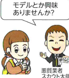
悪質業者スカウト太郎

街頭で声をかけてくるスカウトの中には、アダルトビデオの出演であることを隠して勧誘してくるものがあります。スカウトの勧誘に立ち止まったり、返事をすると思われ、相手にしないようにしましょう。