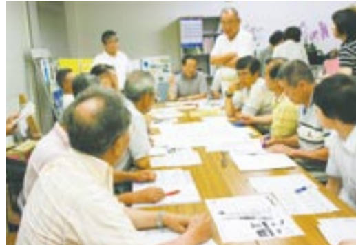
図面を見ながらテントの配置を検討する実行委員会のメンバー

午後7時30分、赤間駅北口にある建物の一室が、活気に溢れています。「赤間駅前カムカム祭り」実行委員会です。