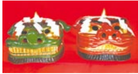
土穴生目八幡神社に安置されている獅子頭