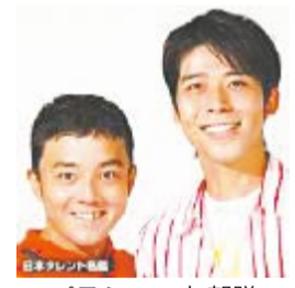
パラシュート部隊