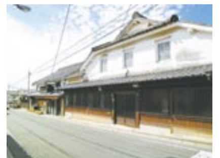
旧唐津街道・赤間宿の街並み

江戸時代の風情を残す赤間宿の町並みを散策し、老舗酒蔵を巡ります。正助ふるさと村では、新そばや各種特産品を販売。また、宗像地方指折りの古社で赤間庄の総鎮守である八所宮や、その神宮寺である長福寺を訪ねます。