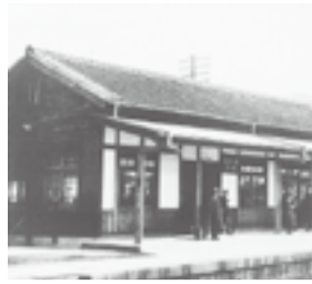
昭和14年ごろの赤間駅

【明治23年】 九州鉄道（国鉄・JRの前身）の博多〜赤間間が開通し、同時に赤間駅が開業