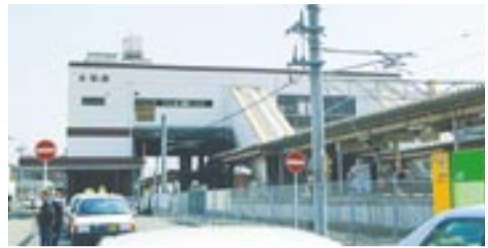
橋上駅となった赤間駅（平成15年撮影）

南口駅前広場完成（駅舎は、福岡県警・宗像署の指導を仰ぎ、壁面などに透明のガラスを採用して防犯体制を強化）