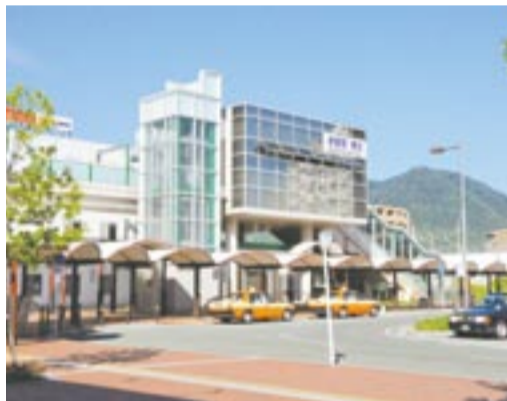
現在の赤間駅南口