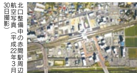
北口整備中の赤間駅周辺 航空写真（平成22年3月30日撮影）