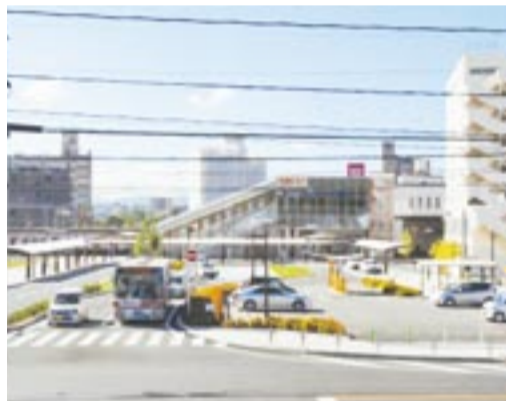
現在の赤間駅北口