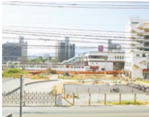
工事中の赤間駅北口（平成20年）