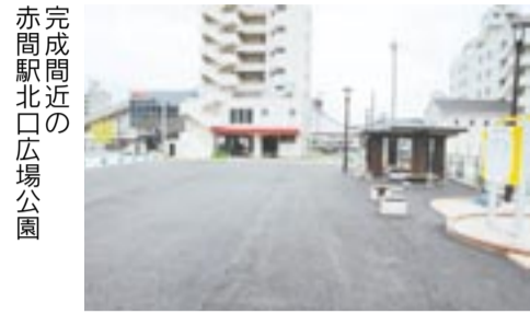
完成間近の赤間駅北口広場公園