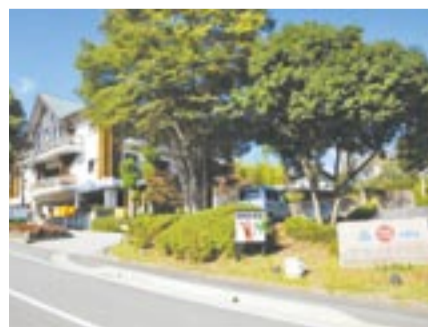
新そばも味わえる正助ふるさと村