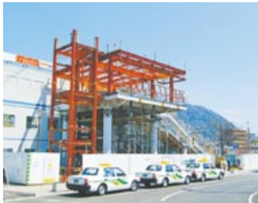
工事中の赤間駅南口（平成16年）