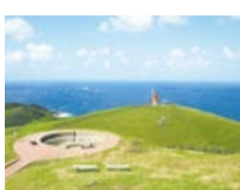
牧場、風車展望台の向こうに玄界灘を望む最高のロケーション

期間限定で、地元島民による「大島観光ガイド」が、島内の観光スポットを案内します。砲台跡・風車展望台など島北側の景勝地はもちろん、世界遺産暫定リストに登録された「宗像・沖ノ島と関連遺産群」の中津宮、沖津宮遙拝所も案内します。所要時間は約1時間30分で、移動手段はマイクロバスです。ぜひこの機会に、魅力いっぱいの秋の大島に来てください。