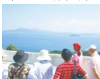
晴天時、御嶽山の展望台からは英彦山や福岡タワーも見えます