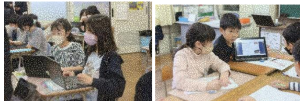
効果的な発表となるよう、内容を見直しています！