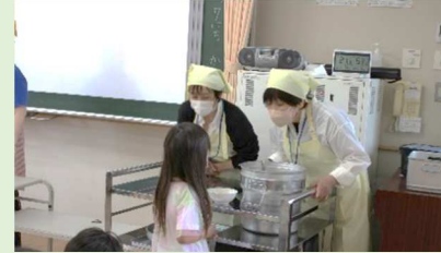
給食配膳ボランティア【1年】