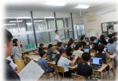
東郷小モニター会