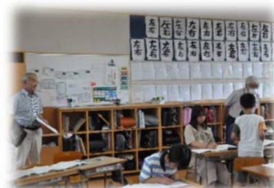
南郷小モニター会