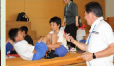
新体カテスト【全学年】