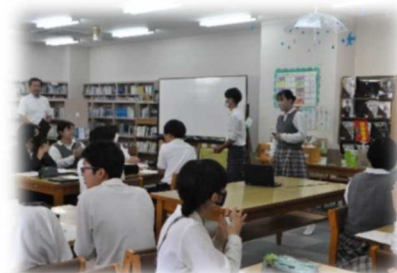
中央中モニター会