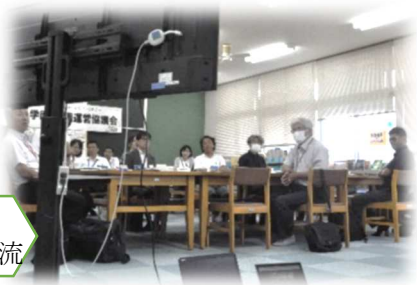
協議会での 意見交流

○道徳科の「よりよい学校生活を送ろうとする ことよさ」についての学習では, 地域のこ も発信していて「ふるさとを愛する」にもつな がっていた