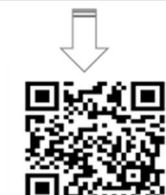
【一般会員はこちらへ】