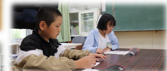
山笠インタビュー