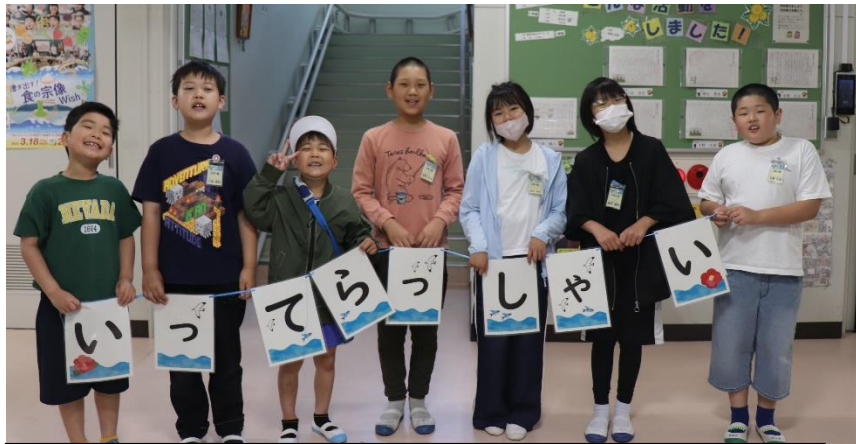
けんとさん いってらっしゃい！！