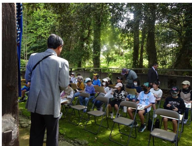
吉武の宝：長宝寺の見学