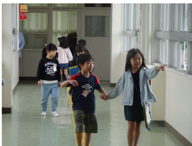
2年生が1年生を案内した学校探検