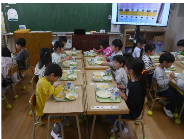
1年生 初めての学校給食