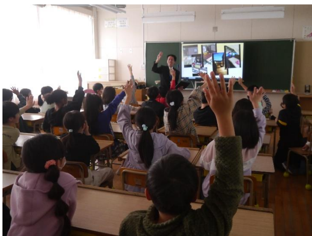
新しい担任との学級開き