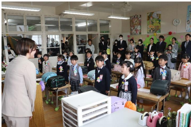
緊張しながらもがんばった入学式

4月 そんな子供の姿がさっそくみられました。4月末の学習参観でも見ていただけたのではないかと思います。