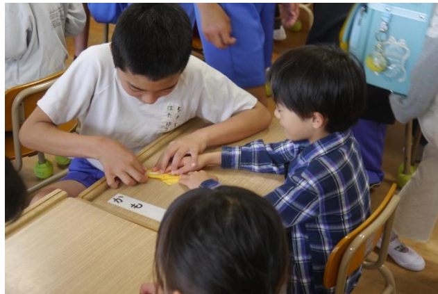
毎朝の1年生への指導（6年生）