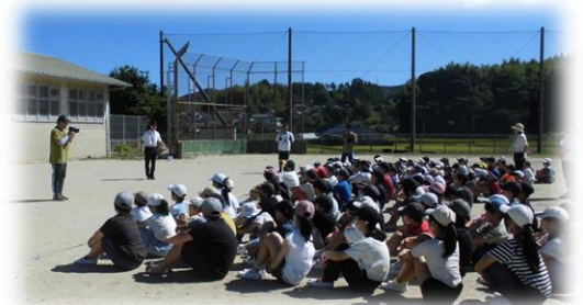
終始無言の立派な避難訓練でした。

大きな地震が本当に起きた時は、勤務先や交通機関の関係上、お家の方の迎えが遅くなることも考えられます。各ご家庭におかれましては、遅くなっても必ず迎えに行くから先生と一緒に待つということを、お子さんに、しっかり伝えておいてください。よろしく願いいたします。