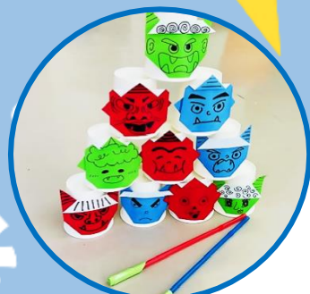
室内クラフト 吹き矢で鬼退治♪