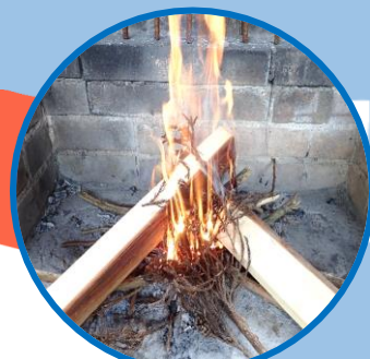
たき火・ 火起こし体験♪