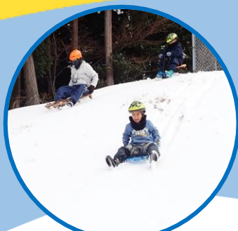
そり・かまくら 雪だるまづくり♪