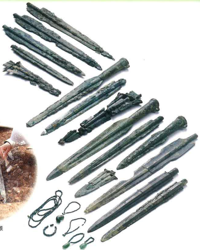
墓域から出土した 武器形青銅器と装身具