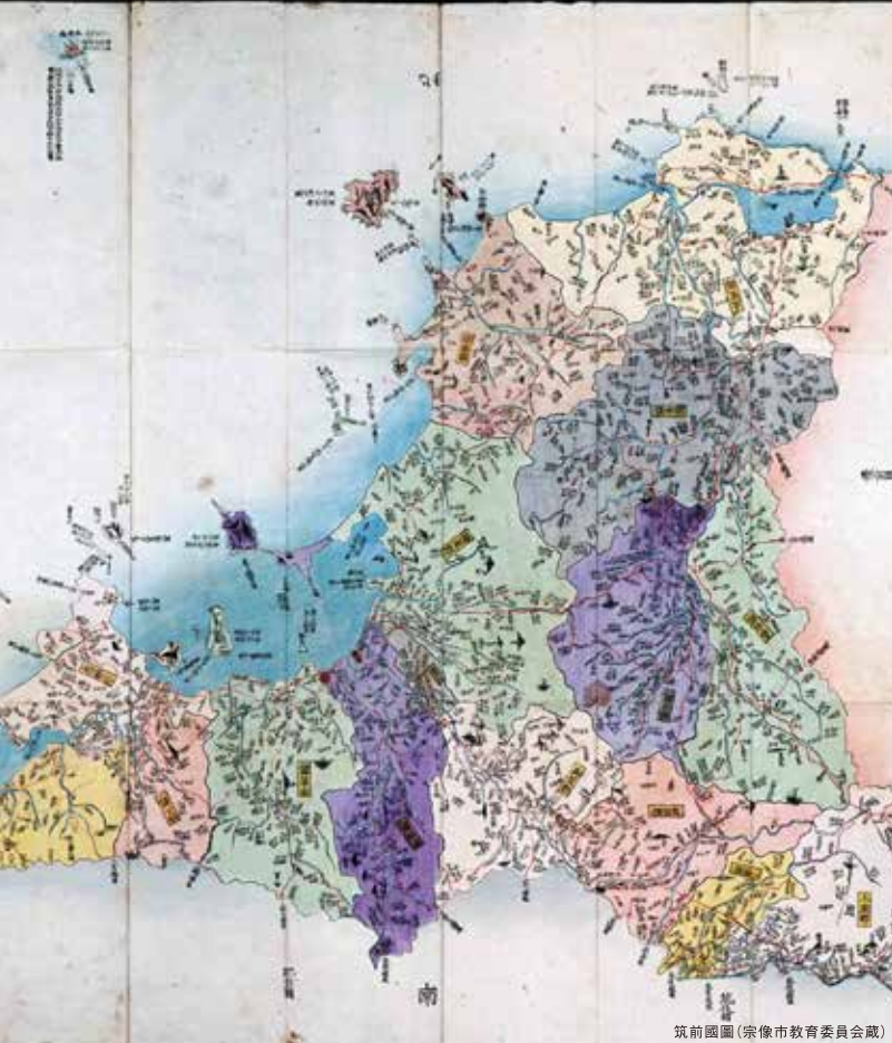
筑前國圖