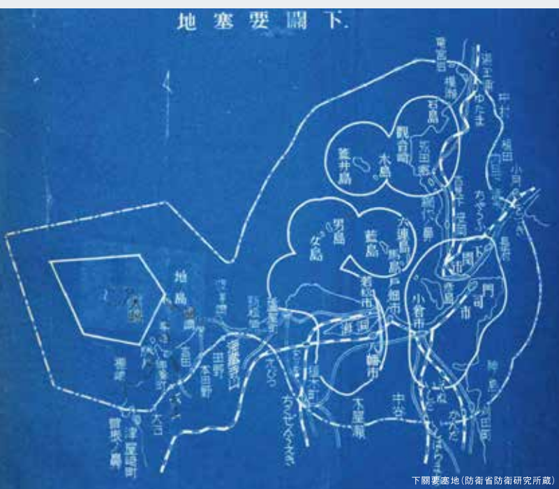
下關要塞地