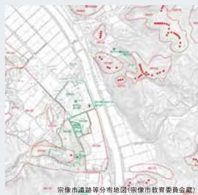
宗像市遺跡等分布地図(宗像市教育委員会蔵)