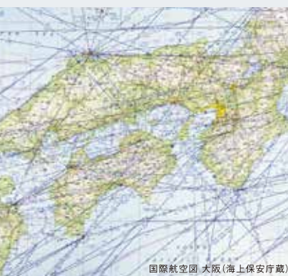
国際航空図 大阪(海上保安庁蔵)