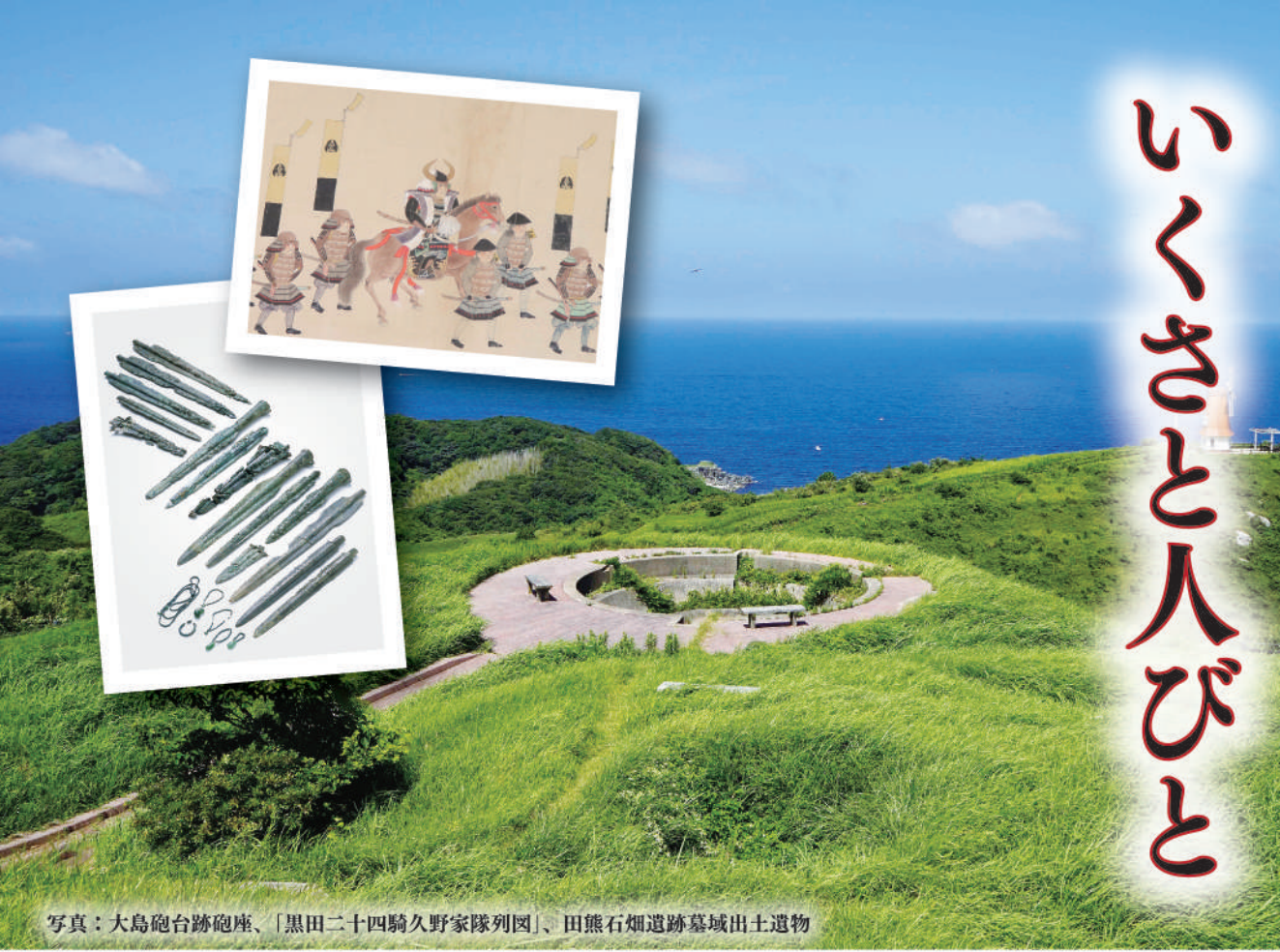
写真：大島砲台跡砲座、「黒田二十四騎久野家隊列図」、田熊石畑遺跡墓域出土遺物