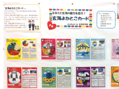
《取り組み展示の例》