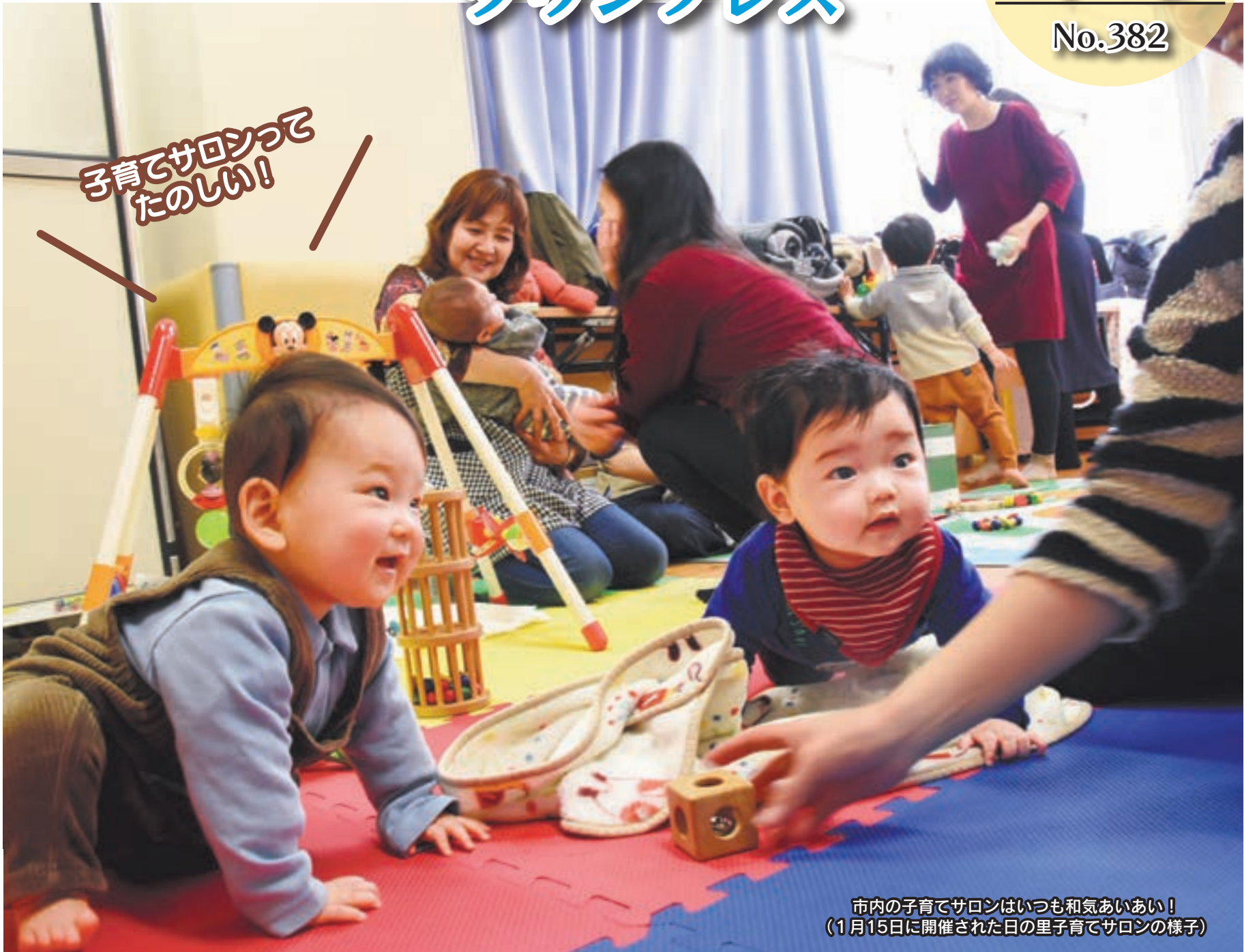
市内の子育てサロンはいつも和気あいあい! (1月15日に開催された日の里子育てサロンの様子)