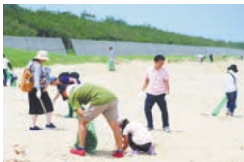
海岸でのクリーンアップの様子