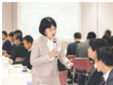
講演中、出席者へ質問をする様子

▶困ったときは消費生活センターに相談を▶警告などが消えない時の対処法=独立行政法人情報処理推進機構☎03(5978)7509へ電話か、同機構HP「情報セキュリティ安心相談窓口」で確認を