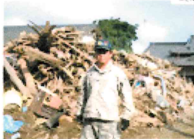
近年の激甚なる地震や暴風の被災地に災害ボランティアとして参加