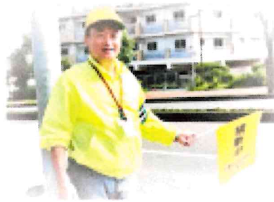
災害市交通安全協会/朝の通学見守り活動