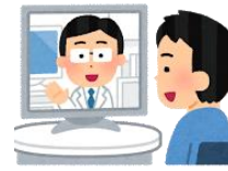
オンライン商談 システムの導入