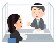
アクリルパネル 設置工事