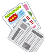
デリバリー開始 の広告費